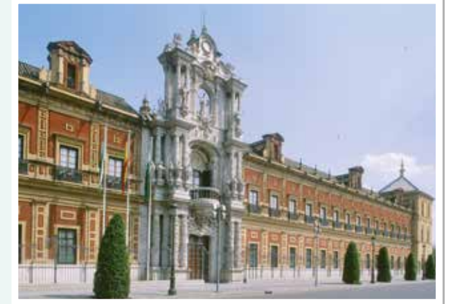
Palacio de San Telmo, en Sevilla. Sede del Consejo de Gobierno.

Las competencias de nuestra Comunidad se ejercen a través de la Junta de Andalucía.