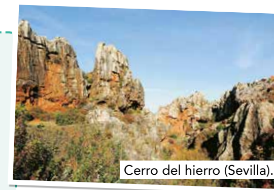
Cerro del hierro (Sevilla).

De esta manera, se han ido conformando los paisajes andaluces que hoy son patrimonio de los territorios que forman Andalucía.